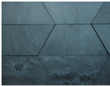
スレートタイル：自然の表情が楽しめる天然素材

無個性であることが、ずっと飽きずに使われる空間を演出します。流行に流されず、様々な空間に適応できる強みを持っています。