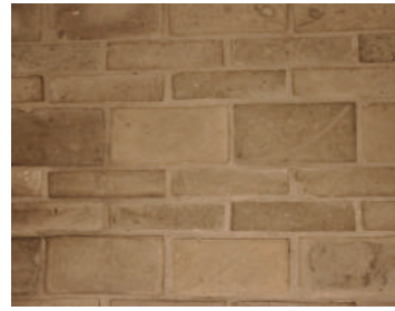
ブリックス：80年以上前の建物から回収した「古レンガ」

石材は地球が長い年月をかけて積み上げてきた地層の一部。地球の歴史そのものと言える石をスライスし、建物に天然の表情を与えます。